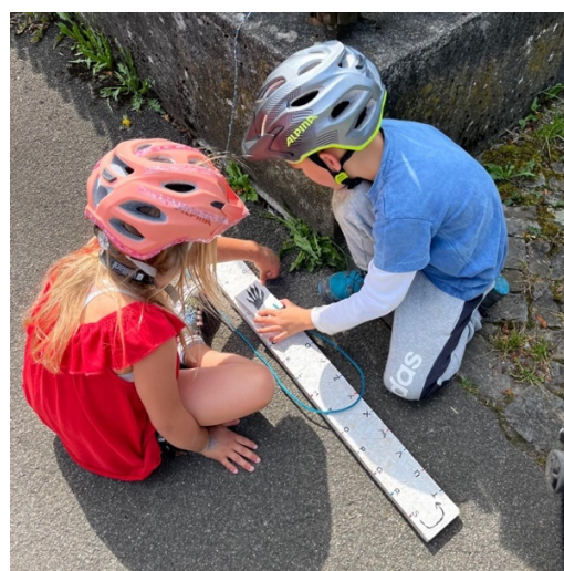
Abbildung 3: Kinder beim rätseln des Postenlaufes

Am Schluss des wirklich langen Foxtrails wartete eine Überraschung. Beim Leonardo Glace durften die Kinder sich über eine kühle Belohnung freuen. Wir danken ganz herzlich dem Sponsor des besten Glaces von Stallikon und allen Kindern, die am Foxtrail teilgenommen haben!