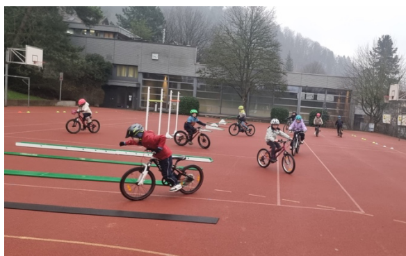
Abbildung 2: BikeControl Projekt im Schulhaus Loomatt

Vom 5. - 7. März durften die 2. und 3. Klassen der Primarschule Stallikon wieder am Bikecontrol-Projekt teilnehmen. Der Swiss Cycling Workshop «Bikecontrol» ist ein spielerischer Geschicklichkeitsparcours für junge Velofahrerinnen und Velofahrer im geschützten Raum.